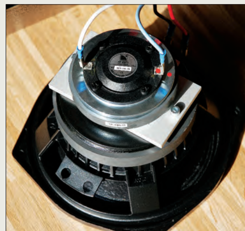
Po vyjmutí reproduktoru (jenž je uchycen pomocí čtyř imbusových šroubů M5 a truhlářských „zasekávacích“ matic) zjistíme, že se jedná o zákaznický systém se zcela odděleným vysokotónovým a hlubokotónovým měničem. Přívody k nim jsou realizovány jednotlivými vodiči s až předimenzovaným průřezem (2,5 mm), zakončenými konektory Faston. Oba měniče nesou označení L-Acoustics.

Ještě k jednotlivým presetům, které je možno použít: V módu X-OVER je odfiltrována část kmitočtového spektra pod 100 Hz a je aplikována shelvingová korekce +3dB na výškách, zhruba od 5kHz výše. Tento mód je určen pro použití se subwoofery SB 15P. V módu MONITOR je aplikována ekvalizace, která vyrovnává zvlnění způsobené vyzářováním do poloprostoru (vazbou s podlahou, stěnou etc.), kdy bez této ekvalizace dochází k zdůraznění na hlubokých kmitočtech a propadu na nižších středech