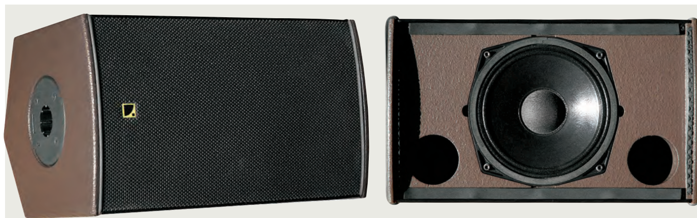
Po demontáži grillu vidíme 8" koaxiální reproduktor s košem odlévaným z lehké slitiny a vyústění dvou kruhových bassreflexových nátrubků o průměru 70 mm. Reproduktor má impregnovanou papírovou membránu (dle tvrzení výrobce „weather-proof“, tedy odolnou proti zmoknutí) o čistém průměru 150 mm se závěsem dvojitou vlnkou.

proof“, tedy odolnou proti zmoknutí) o čistém průměru 150 mm se závěsem dvojitou vlnkou.